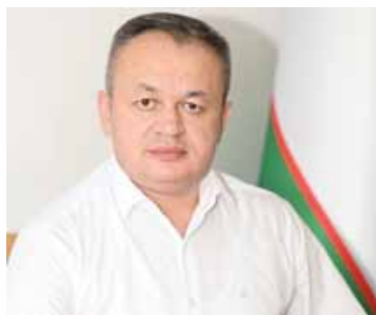
Диверсификация, инвестиция ва илгор технологиялар

Муаммо шундаки, Марказий Осиё мамлакатларидаги электр энергетикаси тизими эскириб кетган. Аммо минтақамиз гидроренергетика соҳасини ривожлантириш учун катта салоҳиятга эга. Янги давлатимиз раҳбари таъкидлаганидек, Тожикистон билан Зарафшон дарёсида ГЭС қуриш лойиҳаси биргалликда ишлаб чиқилмоқда. Қирғизистонда "Қамбарота ГЭС-1" лойиҳасини амалга ошириш масаласи фаол ҳал этилмоқда.