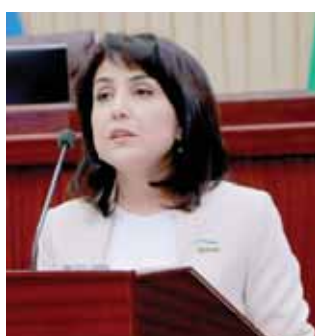
Ойдин АБДУЛЛАЕВА, Олий Мажлис Қонунчилик палатаси депутати.