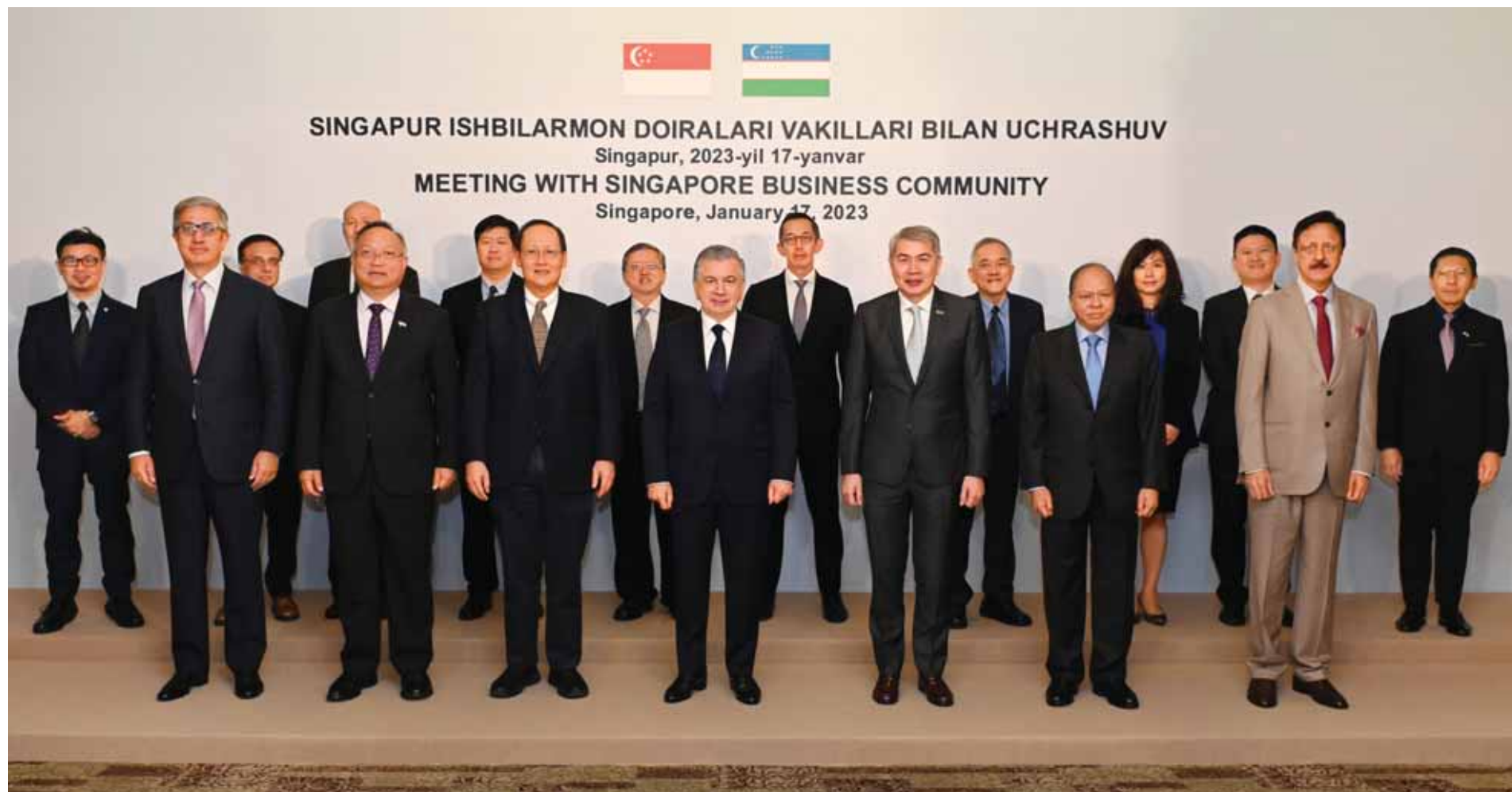
SINGAPUR ISHBILARMON DOIRALARI VAKILLARI BILAN UCHRASHUV Singapur, 2023-yil 17-yanvar MEETING WITH SINGAPORE BUSINESS COMMUNITY Singapore, January 17, 2023