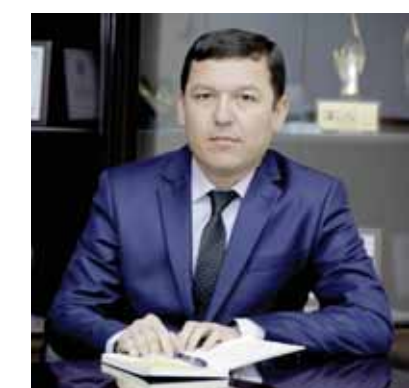
Молия институти 5230600 — "Молия" таълим йўналишига таянч ҳисобланади, унинг ўқув режасини ишлаб чиқиши белгиланган. Бу эса бошқа ОТМда ўқитилмайдиган худди шу йўналишдаги фанлардан ташқари мустақил фанлар киритиш имконини бермаган. Натияжада олий таълим муассасалари ўртасида ўзаро рақобат қилиш учун фундаментал шароитлар яратилмаган.

Биринчидан, ОТМнинг академик мустақиллиги йўқолди. Масалан, Тошкент