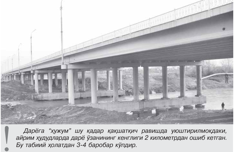
Дарёга “хужум” шу қадар қақшатқич равишда уюштирилмоқдаки, айрим ҳудудларда дарё ўзанининг кенлиги 2 километрдан ошиб кетган. Бу табиий ҳолатдан 3-4 баробар кўпдир.