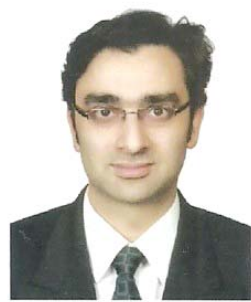
Масаёши Фугами, директор проектно-государственного Центра экологического сотрудничества Японии

— Президент Узбекистана на крупных международных мероприятиях последовательно выдвигает важные инициативы глобального характера. Так было и в ходе основной пленарной сессии Конференции ООН по изменению климата (COP28) в Дубае.