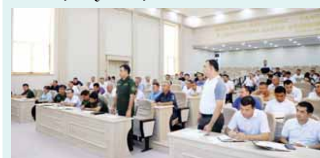
Қорақалпоғистон Республикаси Тупроққалъа тумани ҳокимлигида Хоразм вилояти прокурори М. Аҳмедовнинг тадбиркорлар билан очиқ мулоқоти бўлиб ўтди.

Унда тадбиркорлар томонидан, асосан, имтиёзли кредитлаш, ер ва нотура объектлар кадастри масалаларида мурожаатлар билдирилди. Ҳар бир масалани қонуний ҳал этиш юзасидан мутасаддиларга аниқ топшириқлар берилиб, ижроси прокурор назоратига олинди. Ўз навбатида, тадбиркорларга яратилган шартноша муносиб иш ўрни яратилиши ва ишсизликка биргаликда барҳам бериш зарурлиги қайд этилди.