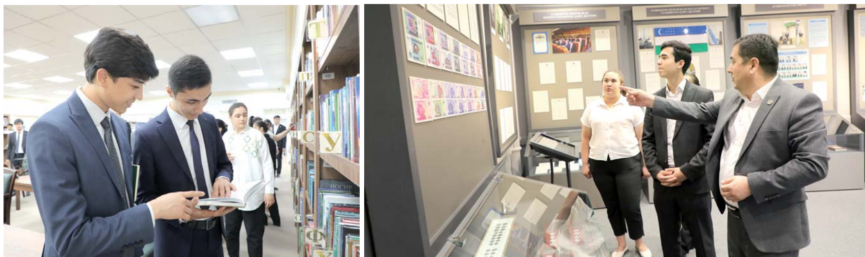
В ходе дня открытых дверей, проведенного в рамках «Месячника молодежи», в Законодательной палате Олий Мажлиса состоялся ряд встреч.