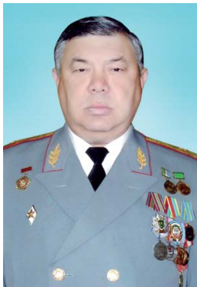
нальных конфликтов, знал повадки боевиков.

ся сводный отряд офицеров, контрактников и рядовых срочной службы. Генерал-майор Шухрат Ниязов особое внимание уделял боевой подготовке личного состава, всегда говорил, что боец не имеет права на ошибку. Он много повидал на своем веку. Несколько раз бывал в горячих точках. Помнил холодную декабрьскую ночь в Алматы, заснеженные горы большого Кавказского хребта в Нагорном Карабахе, знойные прибрежные пески Сумгаита под Баку. Он был человеком, прошедшим через сито межнацио-