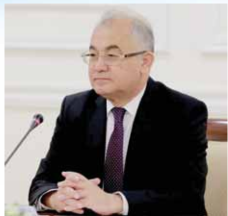
Акмал САИДОВ, Олий Мажлис Қонунчилик палатаси Спикерининг биринчи ўринбосари, Инсон ҳуқуқлари бўйича Ўзбекистон Республикаси Миллий маркази директори.

“Қонунни қабул қилиш — ишнинг ярми, унинг ижросини ташкил этиш