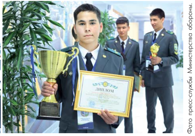
В интеллектуальном турнире приняли участие команды из Узбекистана, России, Беларуси и Кыргызстана. Честь нашей республики в этом году защищали учащиеся Военно-академического лицея имени Джалолиддина Мангуберди в Ургенче...