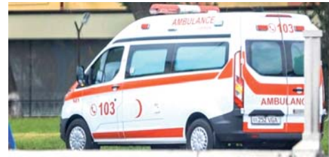
селиению бесплатно. Количество автомобилей «скорой помощи» достигло 3 122, реанимобилям — 577 единиц.

рой медицинской помощи, внедрение в ее практику современных научно-технических средств и информационных технологий позволило значительно сократить этот интервал. Также с 20 до 76 видов увеличен список лекарств, которые находятся в распоряжении фельдшеров и предоставляются на-