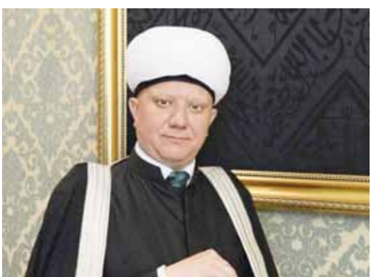
масаласида бугунги Ўзбекистон ибрат-намуна бўлиб келмоқда.

Шундай экан, муқаддас динимизнинг ривож топган, гуллаб-яшнаган масканлари ҳамшиша эъозли саналади. Дунёнинг жуғрофий харитасидан уларни излагудек бўлсангиз, Ўзбекистон заминидан нигоҳингиз тўхтайдми. Нега? Бу саволнинг жавоби учун оддий бўлмаган тарихий ҳақиқатлардан иборат. Яъни Сирдарё ва Амударё бўйлариди қадим-қадимдан деджончилик, чорвачилик, ҳунармандчилик ривожланиб, икки дарё оралиги — Мовароуннаҳрда ўзига хос ўрнига, ўз овозига эга бўлган ўзбек халқи ҳалол меҳнати билан ҳаёт бардавомлигини таъминлаб келган. Муқаддас ислон дини ушбу заминда ёйила бошлаганидан кейин эса мазкур халқдан етишиб чиққан улар зотлар унинг маданияти, маънавияти ва маърифати яловбардорларига айланишган. Бу ҳодиса жуда улкан маданий силжисҳа, уларнинг дунё тамаддунига ислон дини маданияти орқали беқиеъ уллуш қўша олиш имконияти юзага келишига туртки берган. Бунинг дунё эътироф этади. Шунинг учун Марказий Осиё, энг аввало, ҳозирги муस्ताқил Ўзбекистоннинг оддий бўлмаган долғали тарихига назар ташлайдиган бўлсак, унда башарианинг эзгуликка, олийжанобликка, яхшиликка, энг муҳими, жаҳолатдан уйғоншига даъват этувчи мозий садоларини илғаш мушкул эмас.